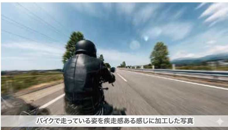
バイクで走っている姿を疾走感ある感じに加工した写真