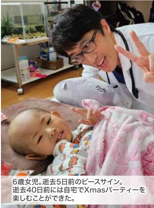
6歳女兒。逝去5日前のピースサイン。 逝去40日前には自宅でXmasパーティーを 楽しむことができた。

『新潟県小児がん患者・家族支援研修会』は、小児がん患者とその家族の支援について関係職種で話し合う場で、新潟大学小児科が主催で毎年開催されている。昨年度は2月にオンライン研修会として開催され、前半の一般演題では、『長期間入院している患児の院内学級の紹介』や『入院中付き添っている家族の心のケアについて』の報告があった。私は後半のシンポジウムにシンポジストとして参加したが、テーマは終末期小児がん患者への在宅ケア。県内全域の在宅医療推進センター関係者、在宅医療に関わる医療者・行政関係者など約90名が参加した。