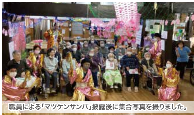
職員による「マツケンサンバ」披露後に集合写真を撮りました。