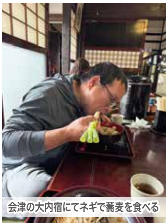
会津の大内宿にてネギで蕎麦を食べる

景を巡る一泊旅行は、心身のリフレッシュと深い感動をもたらしてくれます。自動車では立ち寄れない場所へも自由にアクセスできるバイクは、単なる移動手段を超え、人生をより豊かでクリエイティブなものに変えてくれる特別な存在です。