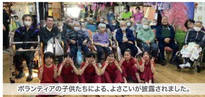
ボランティアの子供たちによる、よさこいが披露されました。