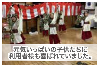
元気いっぱいの子供たちに利用者様も喜ばれていました。

これからも利用者さんに喜んでいただけるよう職員一同、楽しい企画を考えていきます。